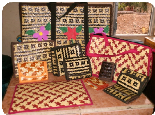
Productos elaborados por las socias de CIENIL

PRESENTACION DE VIDEO RESISTENCIA AL CAMBIO