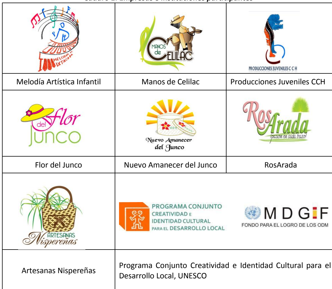
Cuadro 1. Empresas e instituciones participantes

En esta actividad contamos con la participación y el apoyo de las siguientes empresas e instituciones: